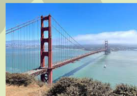
Drochaid a' Gheata Òir