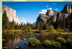
Pairc Naiseanta Yosemite